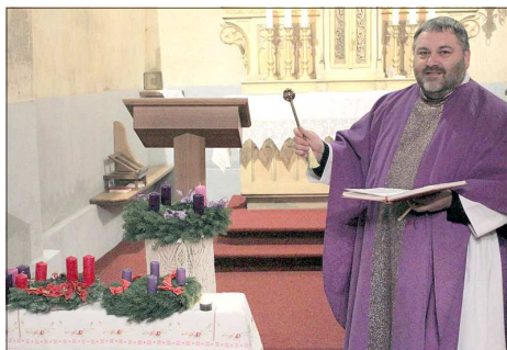
Žehnání adventních věnců v Otvicích