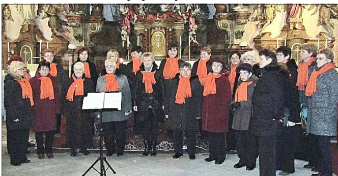
Vánoční písně v podání sboru Jirkovských seniorek u sv. Jiljí.

První zmínka o vánočním stromku pochází z roku 1570 z brémské kroniky. Stromek ozdobený ovocem, sladkostmi a papírovými květinami stál v cechovní budově, kam byly pozvány děti řemeslníků. V průběhu 16. až 18. století se zdobení vánočního stromku šířilo po německém území, roku 1816 stál vánoční stromek i na císařském dvoře ve Vídni. Počátkem 19. století