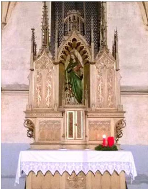
Socha svaté Barbory se po desítkách let vrátila na své místo - do hl.oltáře kostela v Otvicích

* Bohoslužby jsou v Jirkově každý den v 9:00 hod., kromě pátku, kdy je mše v 17:00 hod. a po ní společenství na faře (Výjimka: 19.12. mše již v 16:30). O svátcích a nedělích jsou mše v kostele, v ostatní dny na faře v kapli.