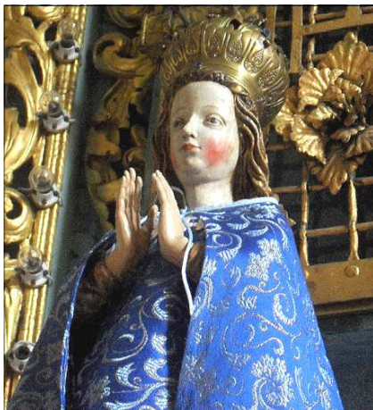
Socha Panny Marie „Květnovské“

Vezměme si Pannu Marii domů, do svých rodin, komunit, společenství! Učme se její víře! Jako byla pro Dona Boska Neposkvrněnou Pomocnicí, tak ať je i pro nás Matkou a Učitelkou.