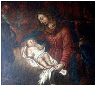
Obraz Narození Ježíše, děkanství Jirkov

Je tomu opravdu tak? Neusvědčuje nás současná situace ze lži? Připomeňme si tu něco důležitého: příchod Božího Syna nezahnal hned temnoty světa, temnotu noci, ale vnesl do ní veliké světlo. Na různých ztvárněních betlémské scény vidíme přece víceméně totéž: v temné stáji leží v jeslích božské Dítě jako jediný zdroj světla. Jeho lesk ozařuje okolí i obličejte těch, kdo mu jsou nablízku – Marie, Josefa, pastýřů. Oni nejsou zcela ve světle, jen jejich oči jsou plné světla. Noc zůstává, ale už v ní není neproniknutelná temnota a strach: je v ní naděje Božího Světla. Proto se smíme radovat z vánočního poselství nejrůznějším způsobem. Je rozumnější zapálit vlastním úsilím malé světlo ve světě než nařikat nad temnotou. Kdo je realista, ví o noci, o temnotě světa, ale i něco o Světle a raduje se z něho. A pak už je jedno, zdali radostné poselství o této skutečnosti prožíváme na sněhu či na pláži.