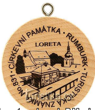
Loreta - domek P.Marie