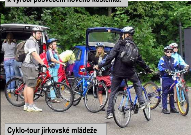
Cyklo-tour jirkovské mládeže po jižní Moravě, najeto 130 km, plavba 5 km. Poruchy byly.