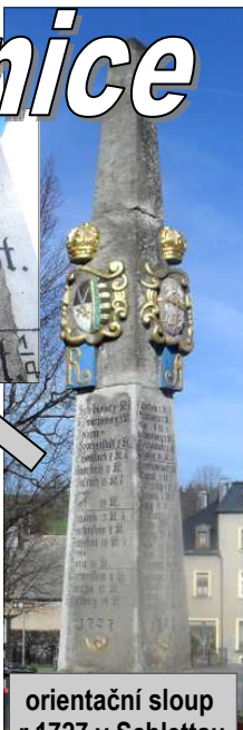
orientační sloup r.1727 v Schlettau

překlad: Hranice Přísečnice 4 hodiny Kadaň 7 hodin Chomutov 9 hodin Praha 21 hodin... Wiessenthal 4 hodiny