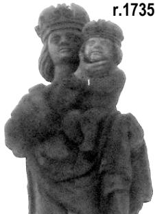
u silnice nad přehradou