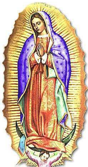
Obraz Panny Marie na indiánském plášti z agávodvé látky

22. dubna 1519 přistál u města Veracruz Hernán Cortés a s 500 vojáky, 14 děly a pomocnými indiánskými sbory započal dobývání Aztécké říše s jejími tehdejšími 8 milióny obyvatel. Po dvou letech urputných a velmi krvavých bojů se Aztékové Španělům podrobili. Tím se zhroutil nejen jejich dobře zorganizovaný svět, ale i cyklus rituů, při kterém bylo ročně obětováno 20 tisíc lidí. Cortés přišel s úmyslem vyhladit starou modloslužbu a podporovat šíření katolické víry. V jeho doprovodu byli ovšem jen dva kněží a teprve v roce 1523 přišli první tři františkáni z Gentu. O rok později přibylo dalších 12 a v roce 1526 přišla na misie první skupina dominikánů. Jejich první učitelé neznámé domorodé řeči Aztéků byly indiánské děti, které rychle pochopily posunčinu a pak pomáhaly jako katecheti ve svých rodinách a vesnicích. Těžké škody misijnímu dílu zasazovali vysocí postavení španělští úředníci počínaje Nuňou de Guzmánem, kteří v rozporu s císařovými instrukcemi nakládali s indiány pro osobní obohacení jako s otroky. Změna nastala teprve, když do Mexika přišel první Římem jmenovaný biskup Fray Juan de Zumárraga. Tím byl udělán důležitý krok pro zdar misijního díla a to, že křesťanství zde zapustilo velmi rychle své kořeny vděčí Mexiko událostem v Guadalupe, které se datují od 9. prosince 1531.