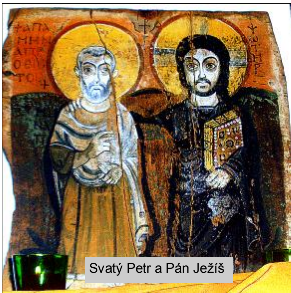
Svatý Petr a Pán Ježíš

Je to Petr, kdo pokládá tuto otázku. Je si vědom toho, že mezi učedníky dojde k nedorozuměním, napětí, slovům či skutkům, které budou zraňovat. Žil s Kristem dostatečně dlouho, aby věděl, že odpuštění je jedinou cestou ze slepé uličky, do níž jsme se dostali kvůli hříchu. Proto se neptá, měl-li by odpouštět či nikoli, ale jak daleko jít. Když nabízí odpuštění sedmkrát, je nepochybně přesvědčen, že dělá hodně. A má pravdu: odpustit tu stejnou chybu sedmkrát je hodně. Petr a ostatní učedníci museli být překvapeni Ježíšovou odpovědí: „Ne sedmkrát, ale sedmdesátkrát sedmkrát“. Jinými slovy bez omezení, bez počítání. Číslo sedmdesát sedm je pravděpodobně narážka na Lamecha, potomka Kaina, který byl za křivdu pomstěn sedmdesátkrát sedmkrát, tedy nepřiměřeně. ( Genesis )