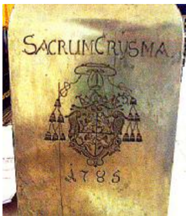
Nádoba na olej v litoměřické katedrále z r.1785 je stále užívaná.

Letos 7.dubna se v litoměřické katedrále konala Missa chrismatis neboli mše svatá spojená s obřady žehnání posvátných olejů. Z těchto biskupem požehnaných olejů jsem, jako každý rok, přivezl menší množství do Jirkova. Budou používány při patřičných bohoslužbách a obřadech. Proč církev vůbec oleje používá? Historie je velmi stará a začíná vlastně s počátkem církve. Olej byl od pradávna užíván jako prostředek k uzdravení, ke kráse, k vůni, k lahodnosti pokrmu, k boji v aréně. Olej je symbolem hojnosti a požehnání, je chápán jako božský dar a znamená vyvolení a povolání.