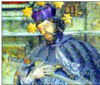
Jan Nepomucký Kostel Jirkov