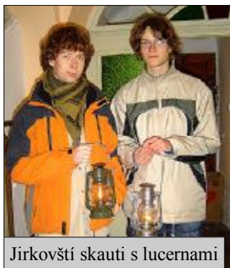
Jirkovští skauti s lucernami

24. prosince 1986 se poprvé v přímém televizním přenosu zapaluje v lineckém studiu ORF betlémské světlo. Před lineckým studiem stojí lidé ve frontě a z vlakového nádraží se Betlémské světlo rozjíždí v kabinách strojvůdců po celém Rakousku. Světýlko má úspěch a nakonec si je nesou domů i ti, kteří se nad celou akcí ze začátku usmívali.