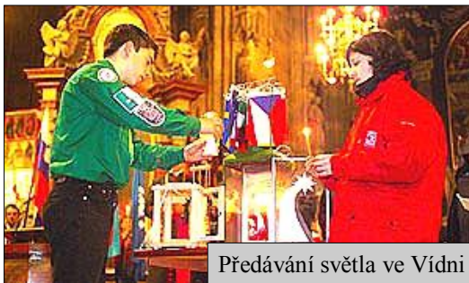
Předávání světla ve Vídni

24. prosince 1986 se poprvé v přímém televizním přenosu zapaluje v lineckém studiu ORF betlémské světlo. Před lineckým studiem stojí lidé ve frontě a z vlakového nádraží se Betlémské světlo rozjíždí v kabinách strojvůdců po celém Rakousku. Světýlko má úspěch a nakonec si je nesou domů i ti, kteří se nad celou akcí ze začátku usmívali.