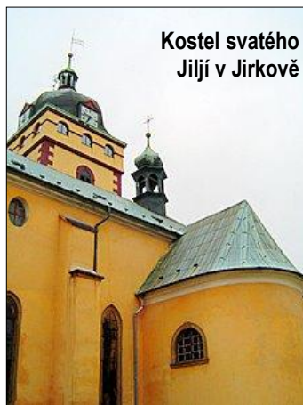
Kostel svatého Jiljí v Jirkově