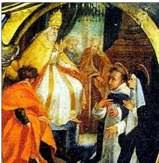
Před papežem Rajmund z Kapuy a Kateřina

co dělat, takže jí byl úplně vzat všechen prostor i čas pro modlitbu. Honili ji z jedné práce do druhé jako služku. Zdoláváním překážek její opravdová odevzanost Kristu jen rostla. Rajmund z Kapuy říká, že z každého útoku ďábla nebo z každého projevu nepřátelství ze strany lidí měla jen prospěch. A ona zase jeho povzbuzovala: „Jestli Vás na Vaší cestě potká něco nového, ať štěstí, či neštěstí, stále si u sebe myslíte: ale já z toho vytluču zisk!“ „Zisk,“ jež Kateřina „vytloukala“ byl objev vnitřní cely .