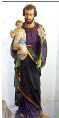
Socha sv. Josefa → a Ježíška, kaple U dubu