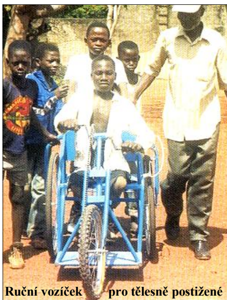
Ruční vozíček pro tělesně postižené

Číslo účtu: 6024090888/2700 – HVB Bank, nám. Republiky, Praha 1, ČR IBAN: CZ93 2700 0000 0060 2409 0888; SWIFT: BACXCZPP