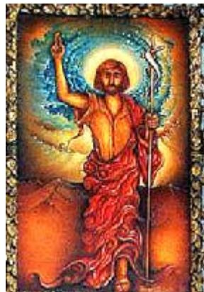
Jan Křtitel, Červený hrádek zámecká kaple (R.Křelina)