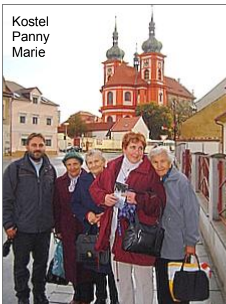
Kostel Panny Marie

místo, kde vznikala česká historie i křesťanská víra, především mariánský kult. V poměrně malém městečku (dnes spojeno s Brandýsem n.L.) existují čtyři kostely (z původních šesti!) a všechny mají svůj velký význam. Jsou to přemyslovský knížecí kostel svatého Klimenta, bazilika svatého Václava (nad místem vraždy sv. Václava) s kryptou sv. Kosmy a Damiána, poutní kostel Panny Marie - Palladia (záštity) země české a kaple blahoslaveného Podivena, družiníka knížete Václava, zabitého ve stejný den (28.9.). My jsme se nejprve účastnili mše svaté na Mariánském náměstí, kde byla po mši vystavena lebka