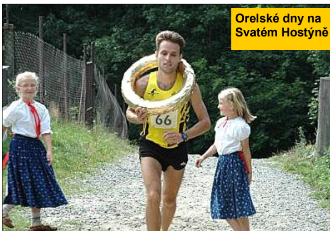
Orelské dny na Svatém Hostýně

Kromě sportu se Orel věnuje také kultuře. Činnost Orla je založena na křesťanských hodnotách. Orel má za sebou více než 90-letou tradici. Během historie byl několikrát zrušen a znovu obnoven. Členy Orla byli například i parašutisté, kteří podnikli atentát na Heydricha. Více informací najdete na www.orel.cz