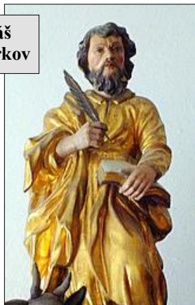
Svatý Lukáš Děkanství Jirkov