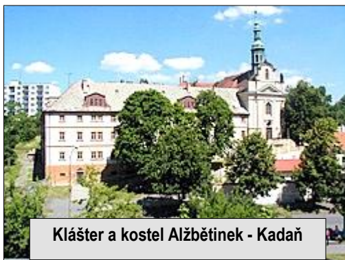
Kláster a kostel Alžbětinek - Kadaň

V Litoměřicích se příliš mnoho nezdržoval, protože velice často cestoval po střední Evropě. V diecézi ho zastupovali postupně čtyři generální vikáři.