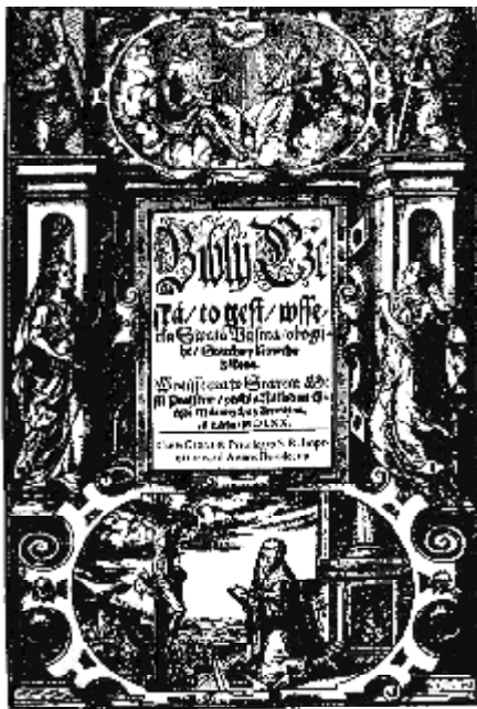
Melantrichova Bible, titulní list 4. vydání z r. 1570 (on klečí před křížem)