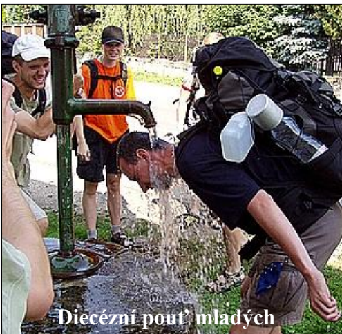
Diecézní pout' mladých

měl v úmyslu doputovat až do Jeruzaléma (!), benediktinští mniši ho však přesvědčili, aby zůstal v jejich klášteře v Římě. Za papežem do Říma se vypravila i Přemyslovna Mlada , pozdější zakladatelka kláštera sv. Jiří na Pražském hradě. Prvním Čechem, který se podle Kosmovy kroniky skutečně dostal až do Svaté země, byl kanovník Osel. Křížové výpravy za osvobození Jeruzaléma se ale v polovině 12. století zúčastnil například i český panovník Vladislav II., který ale nakonec do Jeruzaléma nedošel.