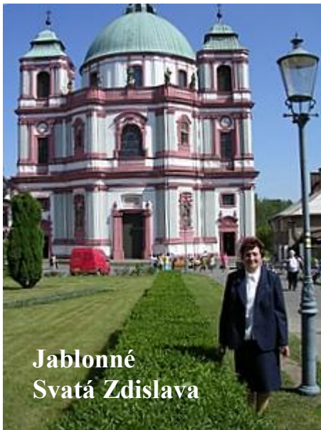
Jablonné Svatá Zdislava

Vykonání pouti bylo pro středověkého člověka náročným, nákladným a nebezpečným podnikem. Zdaleka ne každý zbožný muž či žena si mohli dovolit, aby takové putování podstoupili. Rozhodující přitom zdaleka nebyly pouze finanční možnosti budoucího poutníka, ale také jeho fyzická zdatnost, zdravotní stav a hlavně bezpečnost cest... Jedná se především o dálkové poutě k nejvýznamnějším křesťanským poutním místům spojeným s životem a smrtí Ježíše Krista (do Svaté země), apoštolů (například do Říma či do Santiaga de Compostela), Panny Marie (například do Cách) nebo dalších křesťanských světců a mučedníků. Méně nebezpečné a nákladné byly zbožné cesty k lokálním