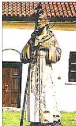
Prokop poustevník Sázavský klášter