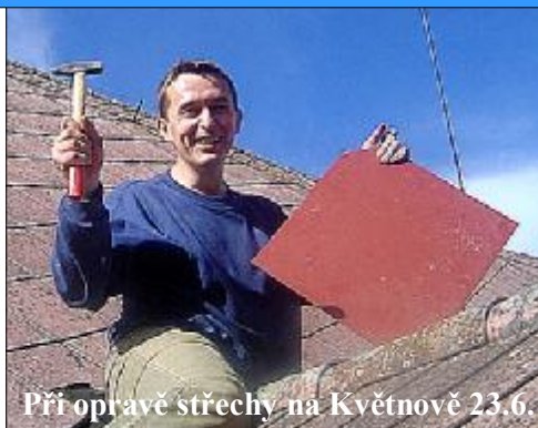
Při opravě střechy na Květnově 23.6.